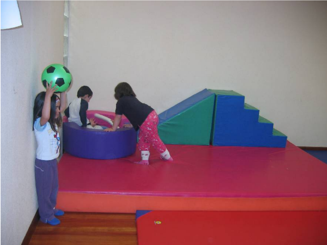
87. argazkia: Bakoitza gure jolasetan gaude.

Irakaslearen papera garrantzi handikoa da; irakasleak ez du oso gogorra izan behar; ez du jokoa manipulatu behar; sustatzaile papera beteko dute eta xehetasun guztiak hartuko ditu kontuan. Gertaera guztien aurrean liluratuta gelditzen dela eta dena sorpresa dela eman behar du aditzera. Sortzailea eta dinamikoa izango da, eta jolasteko gogoia edukiko du.