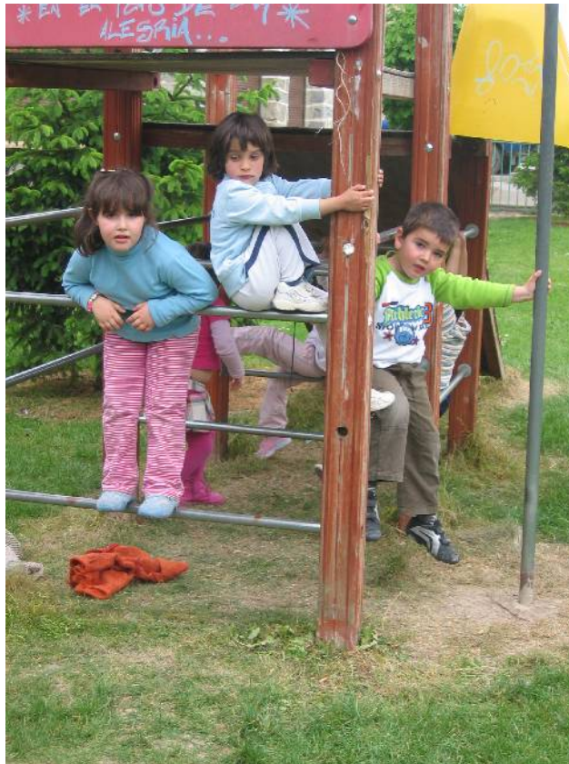
85. argazkia: Zertan ari garen?... Jolasten!!!